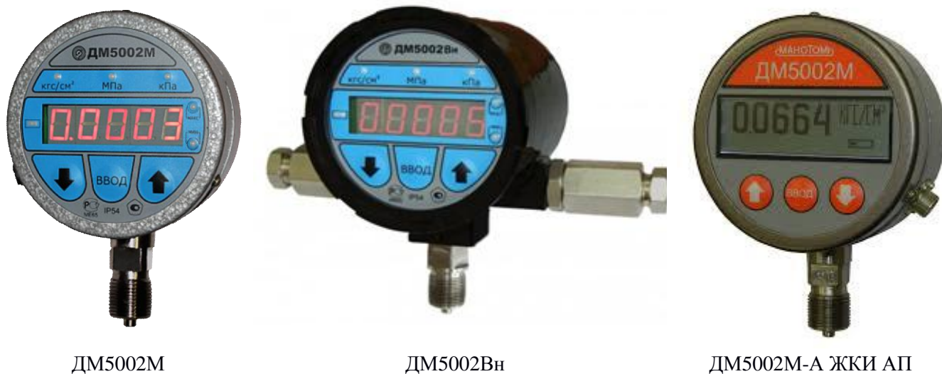
Рисунок 1 – Фотографии общего вида манометров цифровых ДМ5002М, ДМ5002Вн

Общий вид приборов представлен на рисунке 1.