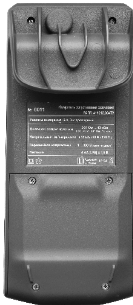
Рисунок 4 – Общий вид измерителей сопротивления заземления ИС-06. Вид сзади