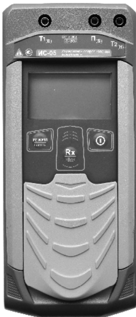
Рисунок 1 – Общий вид измерителей сопротивления заземления ИС-05. Вид спереди