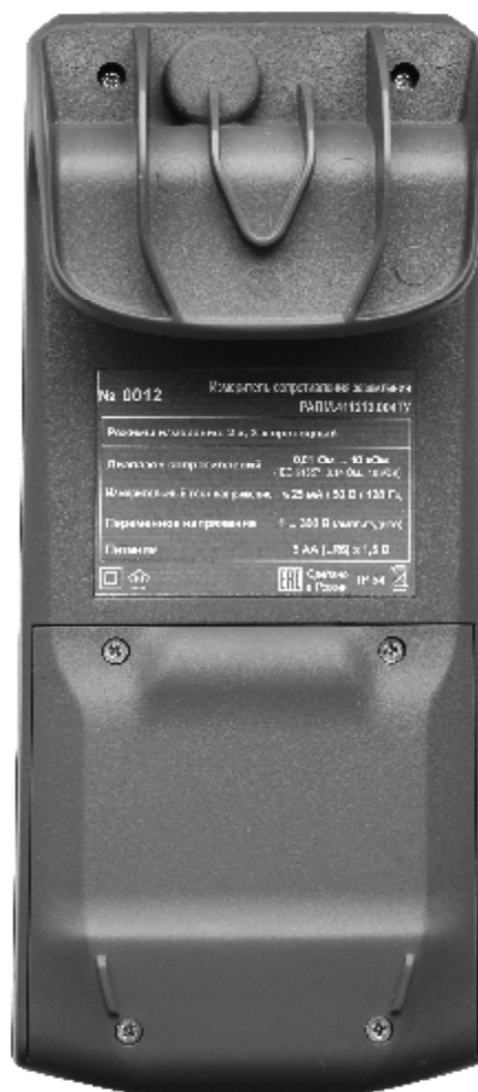
Рисунок 2 – Общий вид измерителей сопротивления заземления ИС-05. Вид сзади